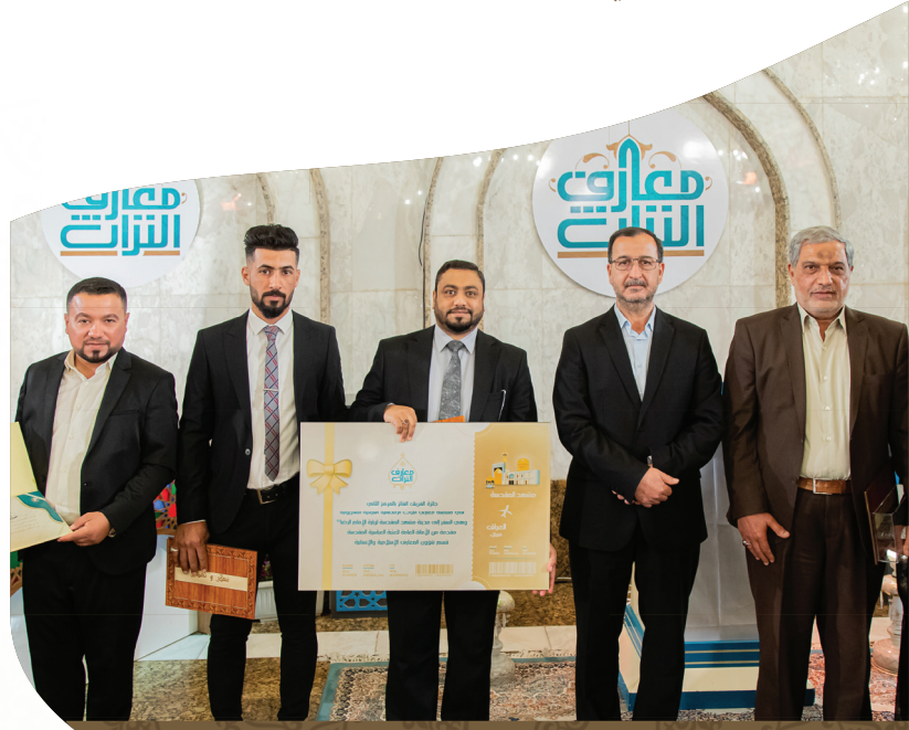
تكريم الفريق الفائز بالمركز الثاني