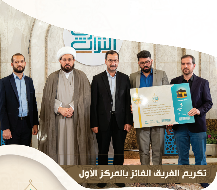
تكريم الفريق الفائز بالمركز الأول

بعدها تم تكريم الكوادر التي اشترك لوجستياً وفنياً في إنجاح المسابقة من قبل عدد من مسؤولي العتبة المقدسة؛ إذ حرصت رئاسة قسم شؤون المعارف الإسلامية والإنسانية على إعطاء كل ذي حق حقه، وسعت جاهدة إلى تقديم شهادة تقديرٍ إلى كل شخصٍ تواجد خلال أيام تصوير المسابقة؛ إيماناً منها بأهمية تشجيع الجميع على بذل المزيد من الجهود في هكذا فعاليات ومبادراتٍ من شأنها إحياء التراث الإسلامي الثرّ وتسليط الضوء عليه.